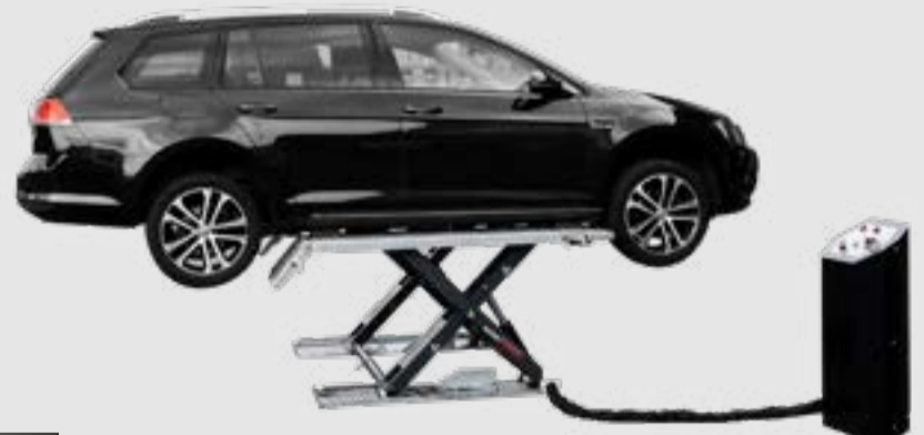
MagiX 35 LSMG