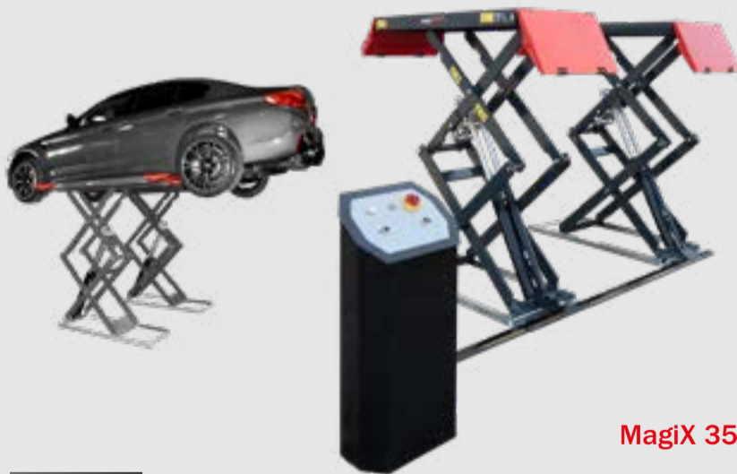
MagiX 35 DS

Bandendiensthefbrug → 3,5 T → opbouw Pont élévateur service pneus → 3,5 T → sur sol